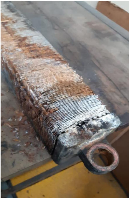
Ilustración 1: Panel Radiador a Reparar